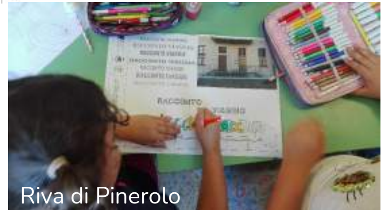
Riva di Pinerolo